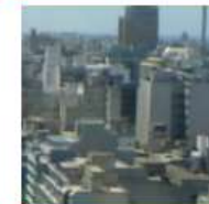
Comisión 9 – Valoración y Gestión de Bienes Raíces