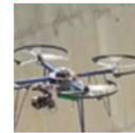
Comisión 6 – Estudios de Ingeniería