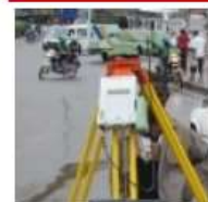
Comisión 5 – Posicionamiento y Medición