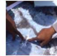
Comisión 7 – Catastro y Ordenación del Territorio