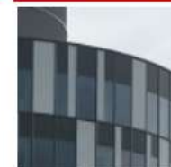
Comisión 10 - Economía y Gestión de la Construcción