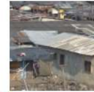
Comisión 8 – Planificación y Desarrollo Territorial