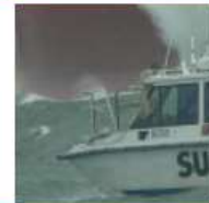
Comisión 4 – Hidrografía