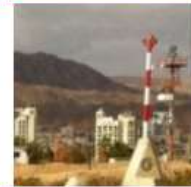
Comisión 1 – Estándares y Prácticas Profesionales