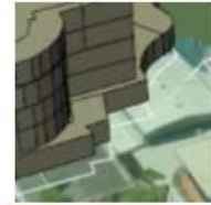
Comisión 3 – Gestión de la Información Espacial