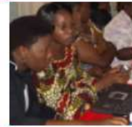
Comisión 2 – Educación Profesional